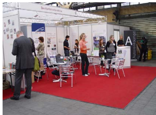
Der Stand der Berufsinformationsbörse an der Buch09

Anfang März 2010 besteht der VIDF aus 25 Mitgliedern aus der gesamten deutschsprachigen Schweiz. Zwei davon sind Passivmitglieder, die restlichen Aktivmitglieder. Im vergangenen Jahr wurden zwei Vereinsaustritte und fünf Vereinsbeitritte verzeichnet. Es wurden insgesamt drei Vorstandssitzungen abgehalten, die teilweise öffentlich waren.