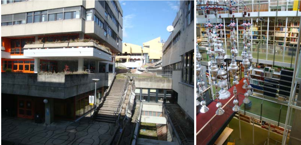
Die UB Konstanz

Die Lehrabschlussfeier der Berner und Zürcher Berufsschulklassen, genannt LAPéro, fand am 2. Juli 2009 in Bern statt. Der VIDF wurde an der Feier durch die Präsidentin und die Sekretärin vertreten. Sie konnten bei dieser Gelegenheit verschiedene Gespräche führen, neue Kontakte knüpfen und die neuen Werbeflyer sowie die Einladungen zum ersten Weiterbildungsausflug, an die neuen Berufskolleginnen und -kollegen verteilen.